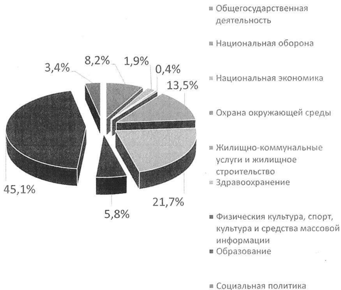
Расходы отраслей консолидированного бюджета Осиповического района