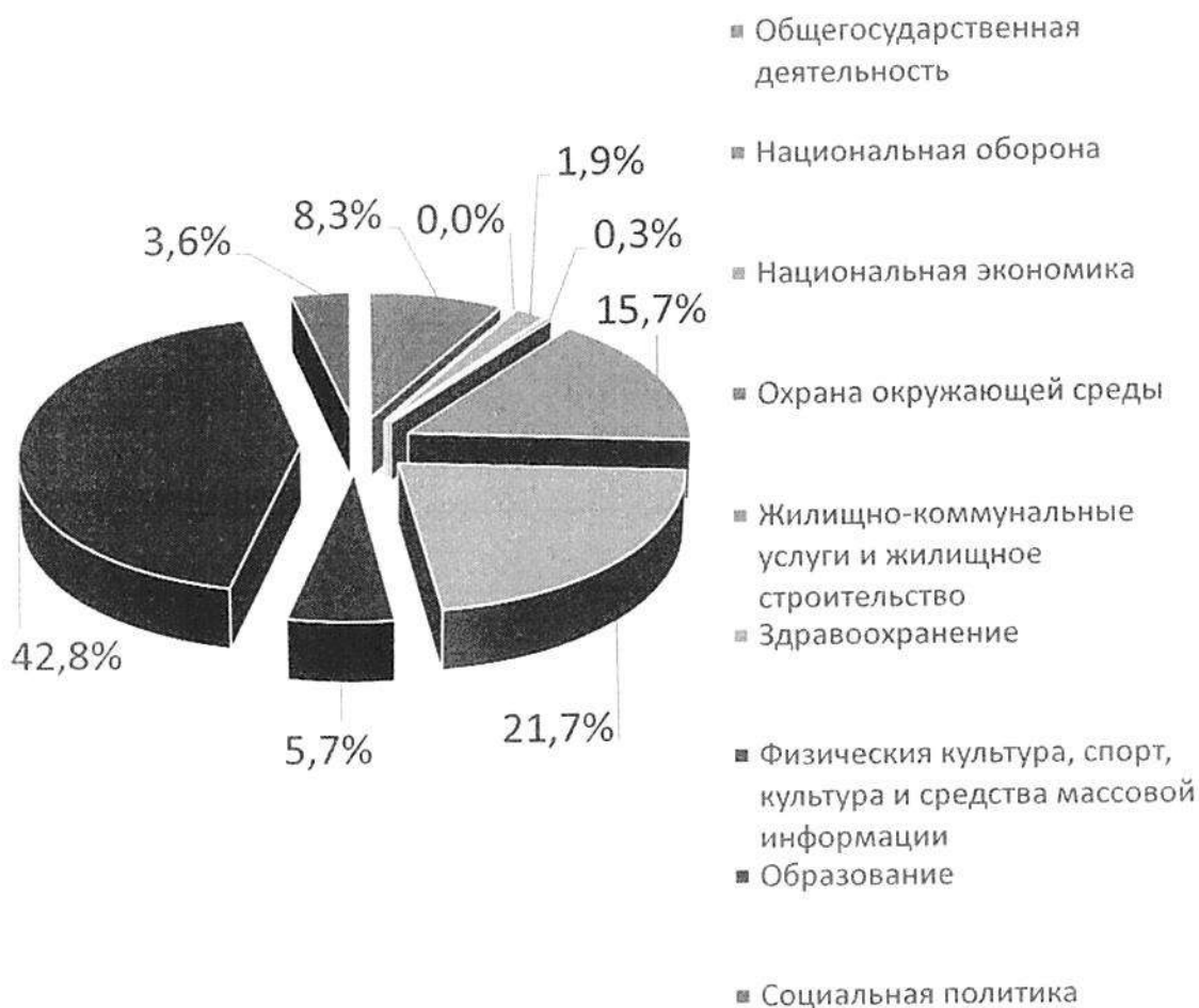
Расходы отраслей консолидированного бюджета Осиповичского района