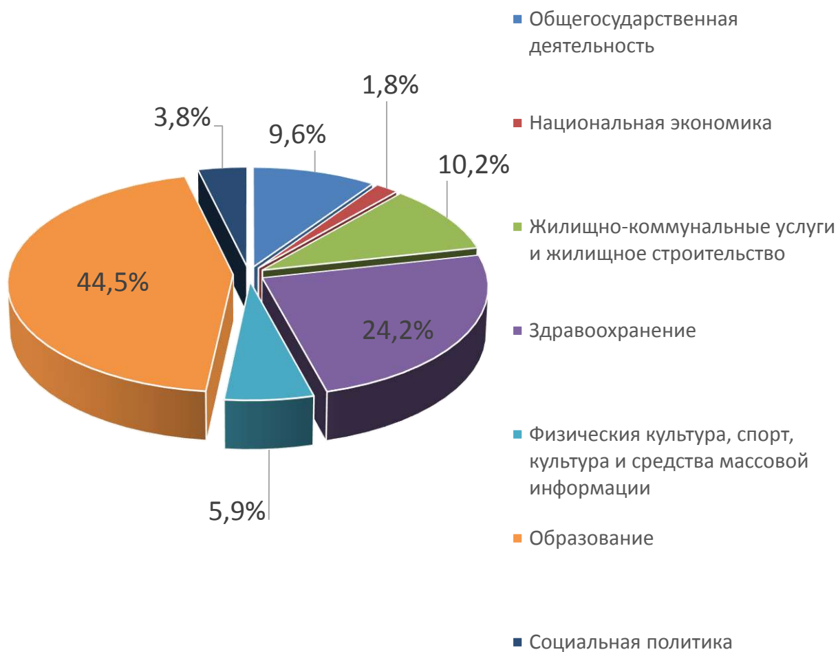
Расходы отраслей консолидированного бюджета Осиповичского района