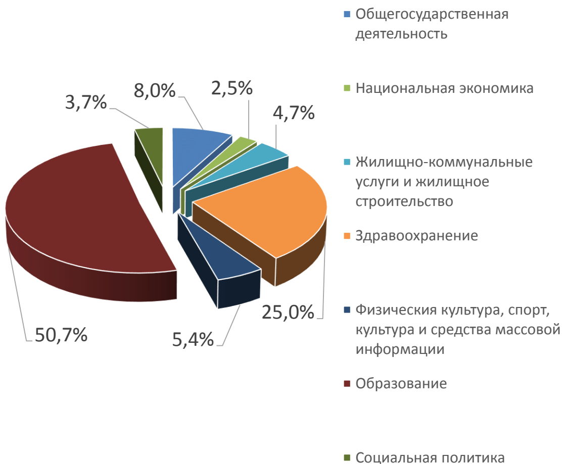
Расходы отраслей консолидированного бюджета Осиповичского района