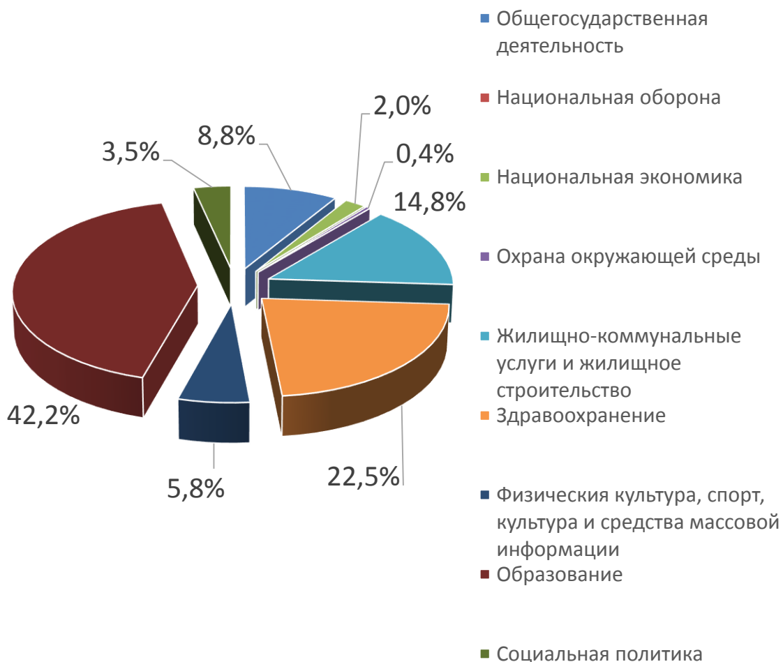
Расходы отраслей консолидированного бюджета Осиповичского района