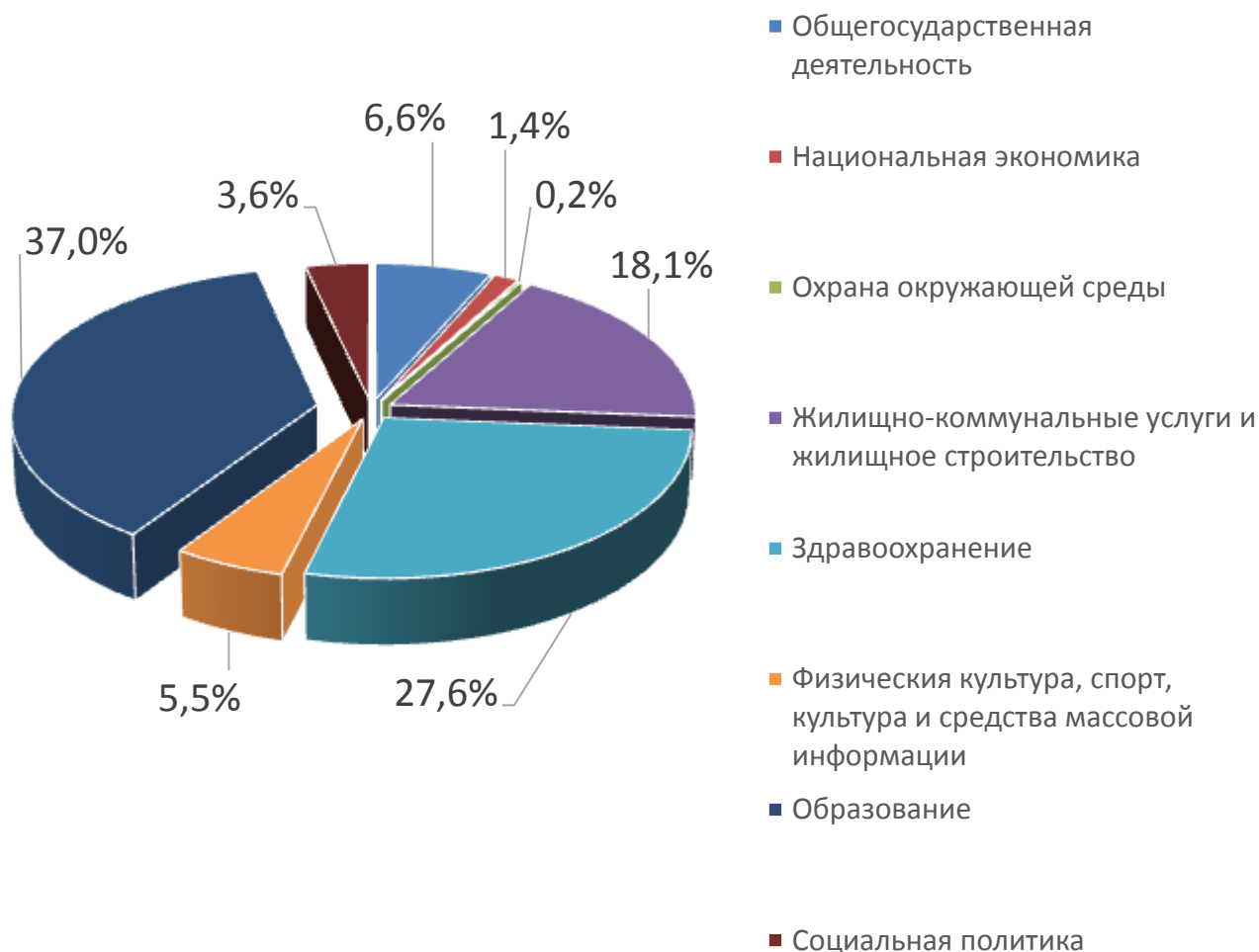
Расходы отраслей консолидированного бюджета Осиповичского района