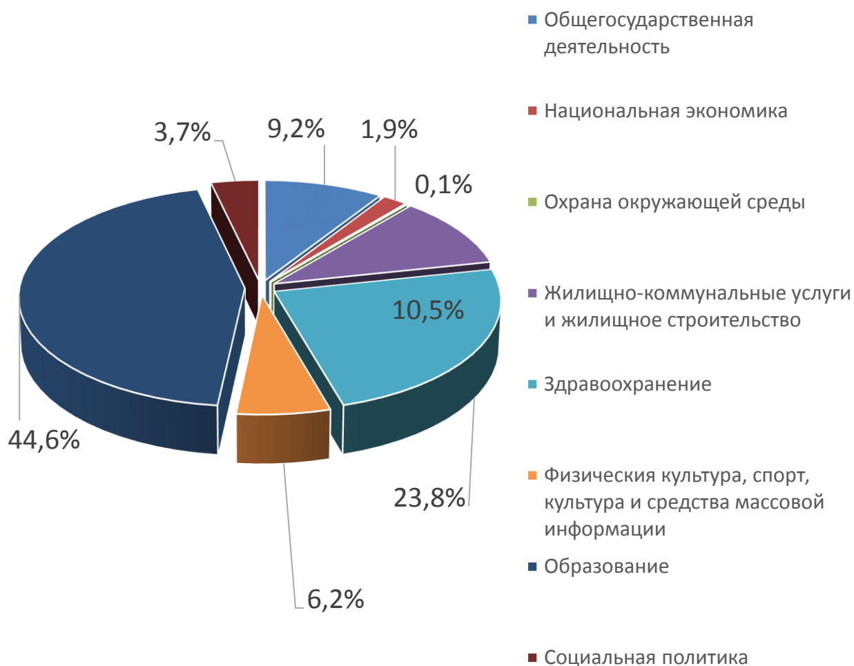
Расходы отраслей консолидированного бюджета Осиповичского района