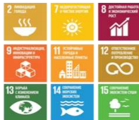
Рис. 2 – Вклад акселератора 1 в достижение ЦУР

Реализация мероприятий регионального акселератора «Экологизация регионального развития» внесет вклад в достижение следующих ЦУР: 2, 7, 8, 9, 11, 12, 13, 14, 16 (рис. 2).