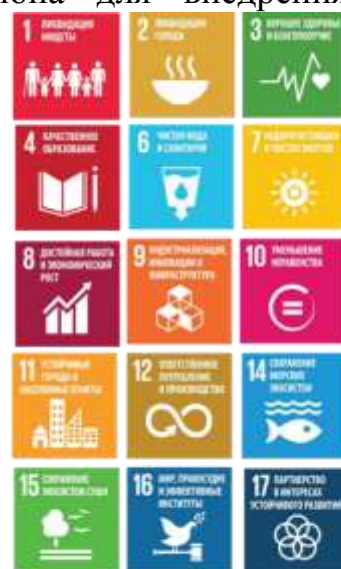
Рис. 4 – Вклад акселератора 3 в достижение ЦУР

Реализация мероприятий регионального акселератора «Территориально-ориентированное развитие и межсекторная кооперация» внесут вклад в достижение ЦУР (рис. 4).