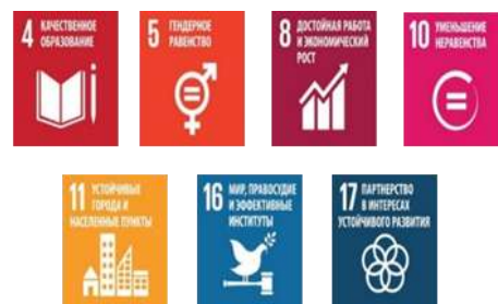
Рис. 5 – Вклад акселератора 4 в достижение ЦУР

Реализация мероприятий регионального акселератора «Вовлеченное управление региональным развитием» соответствует рекомендациям миссии MAPS для достижения целей ЦУР в Республике Беларусь и внесет вклад в достижение всех 17 ЦУР, в наибольшей степени 4, 5, 8, 10, 11, 16, 17 (рис. 5).