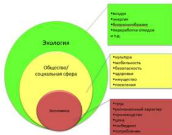
Рис. 1 – Модель сильной устойчивости развития

Видение будущего развития Могилевской области к 2035 г. представлено в соответствии с моделью развития на основе сильной устойчивости (рис. 1). В основе устойчивости развития – экологическая ситуация региона, благоприятная для жизнедеятельности и развития жителей области. Экономика области является эффективным инструментом для сохранения экологии и развития человека в гармонии с природой.